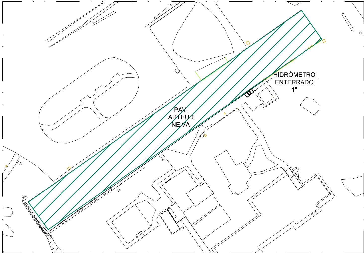
1 PLANTA DE LOCALIZAÇÃO ESCALA 1/500

Ⓜ ABRIGO E HIDRÔMETRO - DIÂMETRO INDICADO